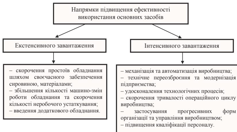
Рис. 2. Напрямки підвищення ефективності використання основних засобів на ПАТ «Славутський комбінат «Будфарфор»

2) впровадження заходів екстенсивного напрямку характеризуються відсутністю необхідності в капітальних затратах, тоді, як підвищення рівня інтенсивного використання – це значні інвестиційні вкладення, котрі поряд із цим, досить швидко окупуються завдяки одержаному додатковому економічному ефекту.