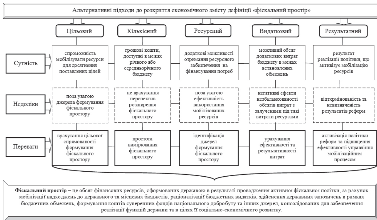
Рис. 1. Альтернативні підходи до розкриття економічного змісту дефініції «фіскальний простір»