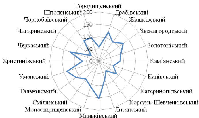
Рис. 2. Кількість діючих сільськогосподарських підприємств за районами у 2013 році*

Посівні площі в усіх категоріях господарств у 2013 р. становили 1203 тис.га і в порівнянні з 1990 р. з обороту виведена восьма частина посівних площ, або 105 тис.га