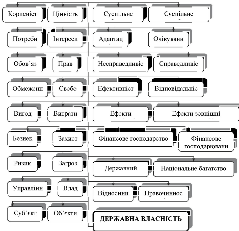
Рис. 1. Елементи сутності державної власності*