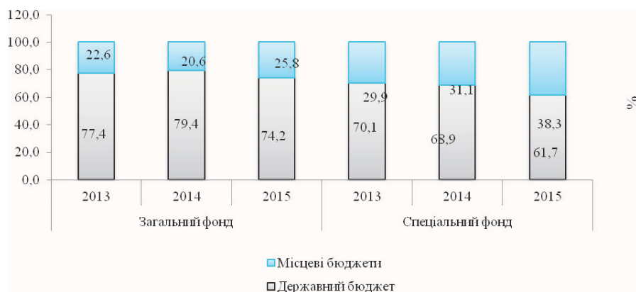
Рис. 1.1. Частка доходів місцевих бюджетів України в доходах зведеного бюджету України за 2013–2015 рр.

Згідно з даними рисунка 1.1. видно, значне переважання доходів Державного бюджету України над доходами місцевих бюджетів у розрізі зведеного бюджету. Щодо динаміки, то протягом аналізованого періоду спостерігалось, як і зростання частки одного показника над іншим, так і зменшення як у структурі загального фонду, так і у структурі спеціального фонду зведеного бюджету України.