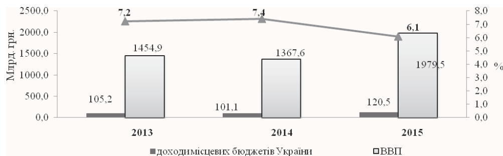
Рис. 1.2. Динаміка зміни частки доходів місцевих бюджетів України у ВВП за 2013-2015 роки

Також одним із найбільш важливіших показників, які характеризують фінансову політику в державі та рівень її децентралізації є ВВП. Валовий внутрішній продукт досить тісно зв'язаний доходами держави, тому проаналізуємо, яку частку у ВВП займають доходи місцевих бюджетів України та визначимо ступінь децентралізації його (рис. 1.2.).