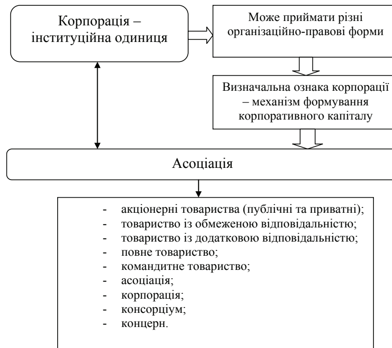
Рис. 3. Організаційно-правові форми корпорацій (розроблено автором на основі джерела 13, с. 57)

Висновки. Корпорація – це договірне об’єднання підприємств своїх виробничих та наукових можливостей для досягнення єдиної комерційної мети шляхом делегування повноважень централізованому органу управління.