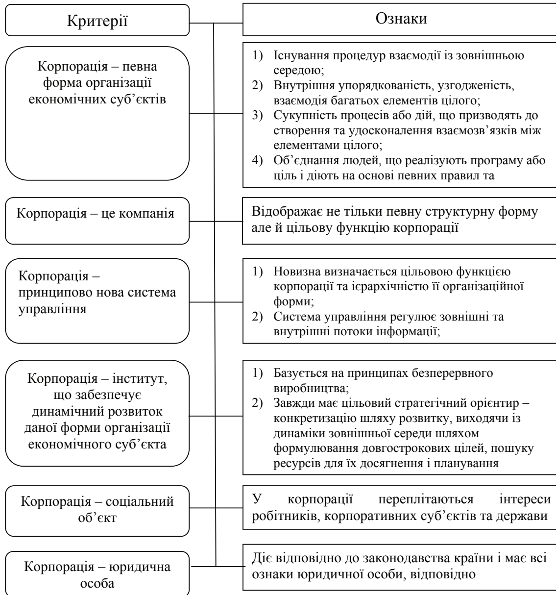
Рис. 1. Сутнісні характеристики корпорації як економічної категорії (розроблено автором на основі джерела 13, с. 36–37)

Корпоративні відносини не можуть існувати без організаційного оформлення, оскільки вони виникають для цілей ведення певної діяльності. Але стосовно корпорацій, то не існує єдиного погляду щодо їх організаційних форм. Так, Х. Окумура до корпорацій, окрім акціонерних товариств, зараховує холдинги [14, с. 79].