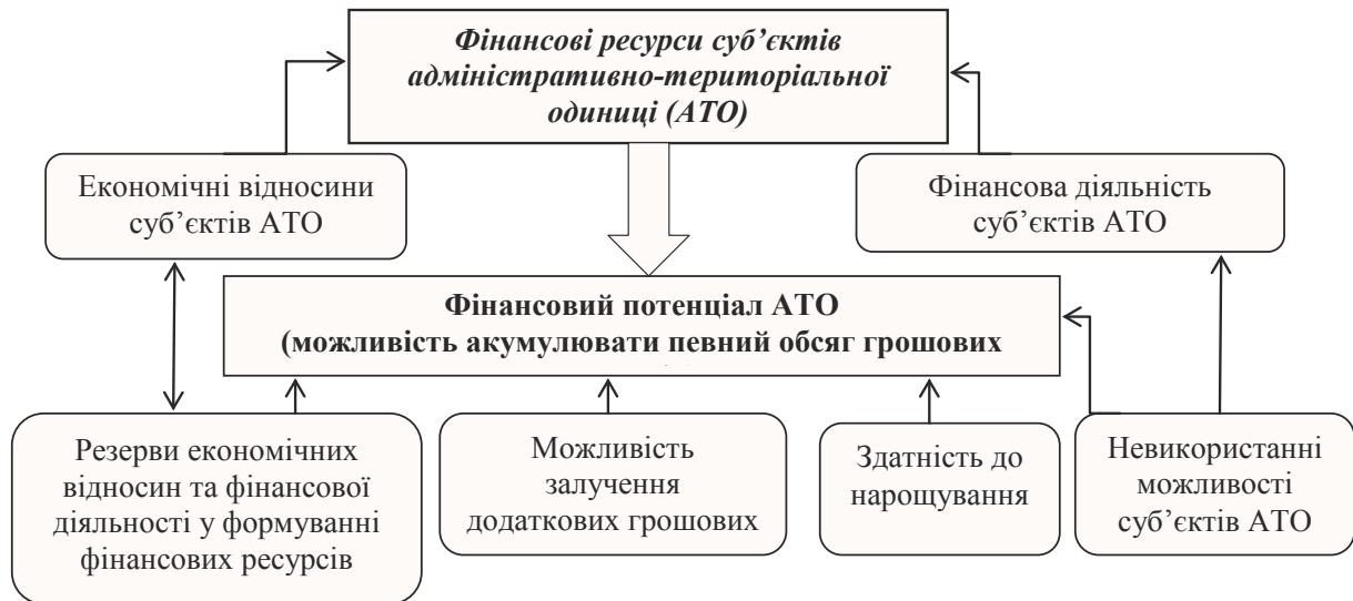
Рис. 1.2. Фінансовий потенціал адміністративно-територіальної одиниці та місце в ньому фінансових ресурсів [розроблено автором]

У ході методологічного дослідження сутності поняття «фінансовий потенціал» ми систематизували визначення цього поняття за такими підходами: ресурсним підходом, системним підходом, підходом із позиції здатності та максималістичним підходом (табл. 1.1).